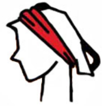
opaska na głowę