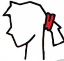
opaska do włosów