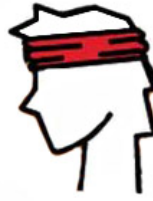
opaska na głowę